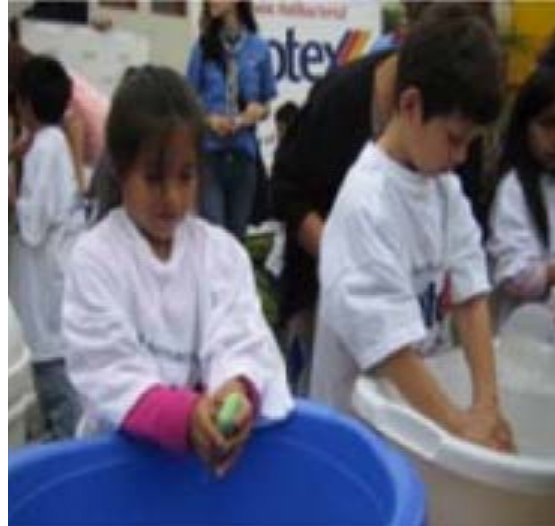
स्वच्छता पर शिक्षा