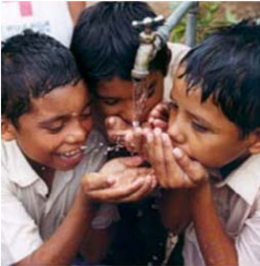
आपूर्ति में वृद्धि